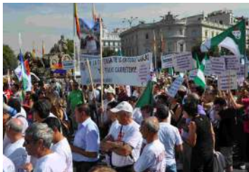
Manifestación contra la supresión de las E.L.As en Madrid.