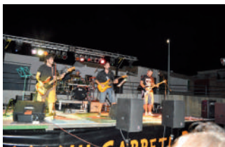
XXIII Carreta Rock