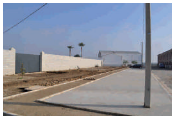
Zona junto al tanatorio.