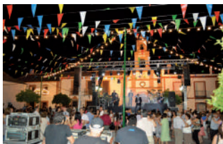
Orquestas en la plaza.