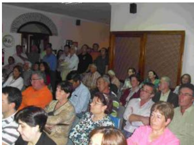
Público asistente al pleno de Fuente Palmera.

El día 13 de septiembre el Pleno de Fuente Carreteros aprueba por unanimidad el expediente, que es presentado al Pueblo en una asamblea celebrada en los días anteriores a su debate en el ayuntamiento colonial.