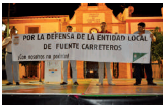
Pancarta contra la supresión de las E.L.As y recogida de firmas.