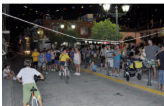
Juegos de Verano.