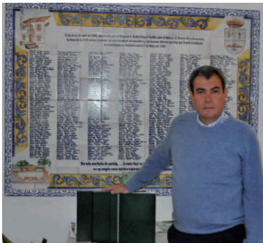
El Alcalde de Fuente Carreteros con el expediente.

A principios de septiembre se reúnen para hacer el seguimiento del proceso todos los partidos políticos que existen en Carreteros: Olivo-independientes, PSOE-A, Izquierda Unida y PP (aunque los dos últimos no tienen concejales en la ELA) y el día 11 del mismo mes se entrega el expediente al alcalde de Fuente Palmera. A partir de ese momento comienzan una serie de reuniones con los grupos políticos del ayuntamiento de F. Palmera para presentarles el expediente y recabar su apoyo al mismo.