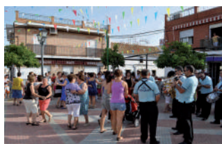
Toque de diana, baile con la Charanga y churros con chocolate.