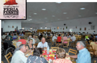
Cena homenaje a la 3ª edad.