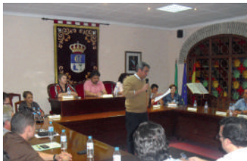
El Alcalde de Fuente Carreteros interviene en el pleno de Fuente Palmera

Todo este proceso hubo que acelerarlo en julio, pues nuestra Entidad Local está en peligro de desaparecer al aprobar el Consejo de Ministros el Informe sobre el anteproyecto de Ley de racionalización y sostenibilidad de la Administración local, en el cual entre otras medidas existe una relativa a la supresión de todas las ELAs del estado, que son más de 3.700. (En otro artículo de este mismo periódico se relata pormenorizadamente toda la lucha de nuestro Pueblo en contra de esta supresión).