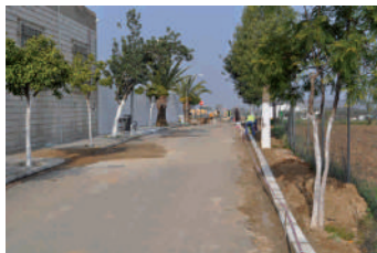
Camino del cementerio

Con estas obras se van a efectuar unas actuaciones para mejorar el entorno del cementerio, dotando de aceras y luz debido a un convenio que tiene que cumplir el Ayuntamiento y a dotar de un aparcamiento en la zona del tanatorio, delimitar el camino en su margen derecho, realización un cerramiento de unos 1.200 metros que servirá para acopio de materiales y de maquinaria y una zona verde.