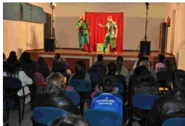
Actuación del Proyecto Avanti con “Los Super”