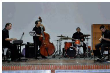
Quattro Jazz Band