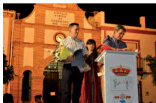
Pregón de Feria.